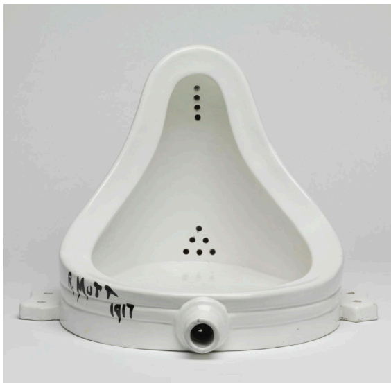
Marcel Duchamp Fountain , 1917 / 1964, Faïence blanche recouverte de peinture 38 x 48 x 63,5 cm, Centre Pompidou

L'art de l'appropriation est une approche innovante consistant à utiliser des images, des objets, des styles ou des techniques existants pour les réinterpréter ou les recontextualiser dans une nouvelle création artistique. Cette approche révolutionnaire étend les frontières de l'art et offre aux spectateurs une expérience visuelle nouvelle. Examinons certains des artistes les plus représentatifs de l'art de l'appropriation et leurs œuvres majeures, ainsi que leur impact sur le monde de l'art.