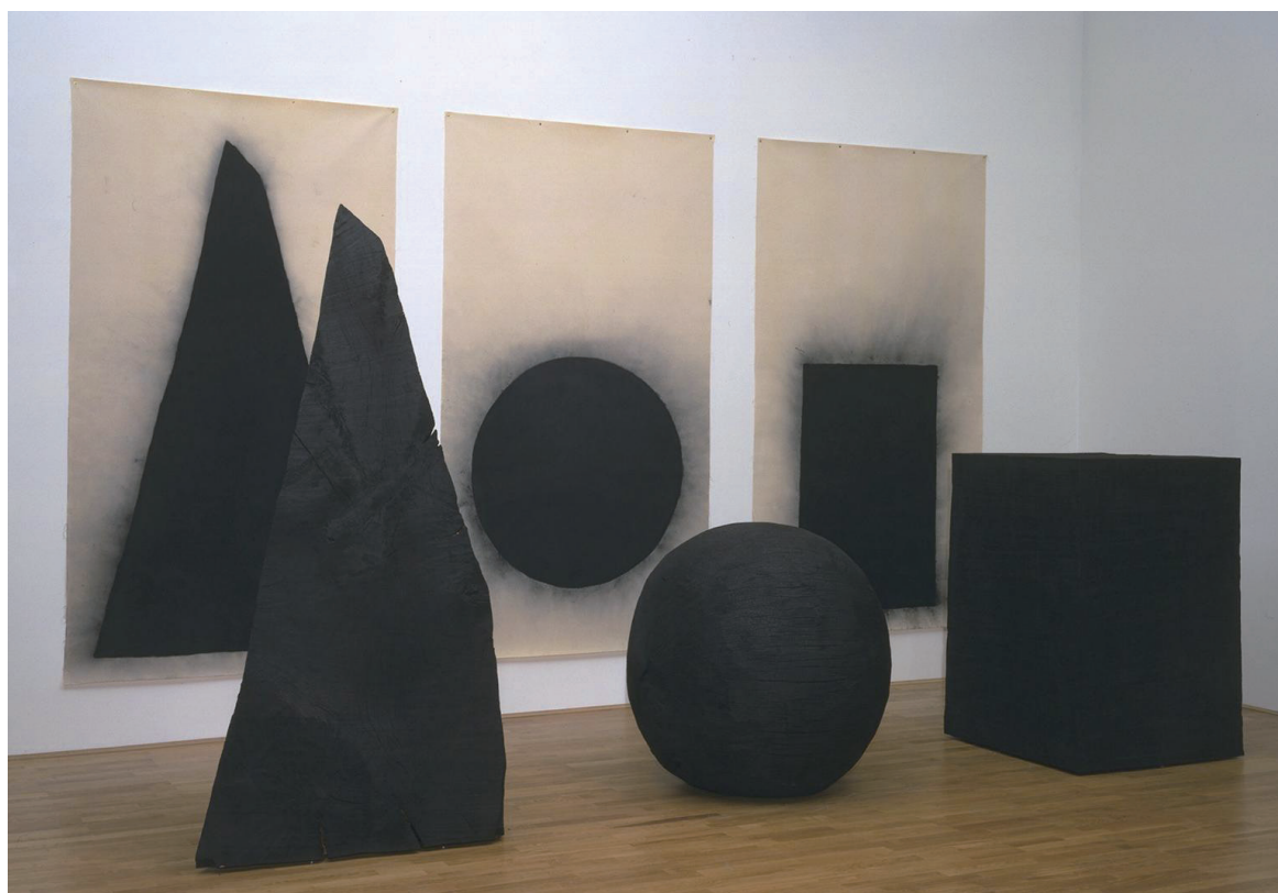
David Nash, Pyramid, Sphere, Cube , 1997-8 Installation, Oak, 320×450×350cm