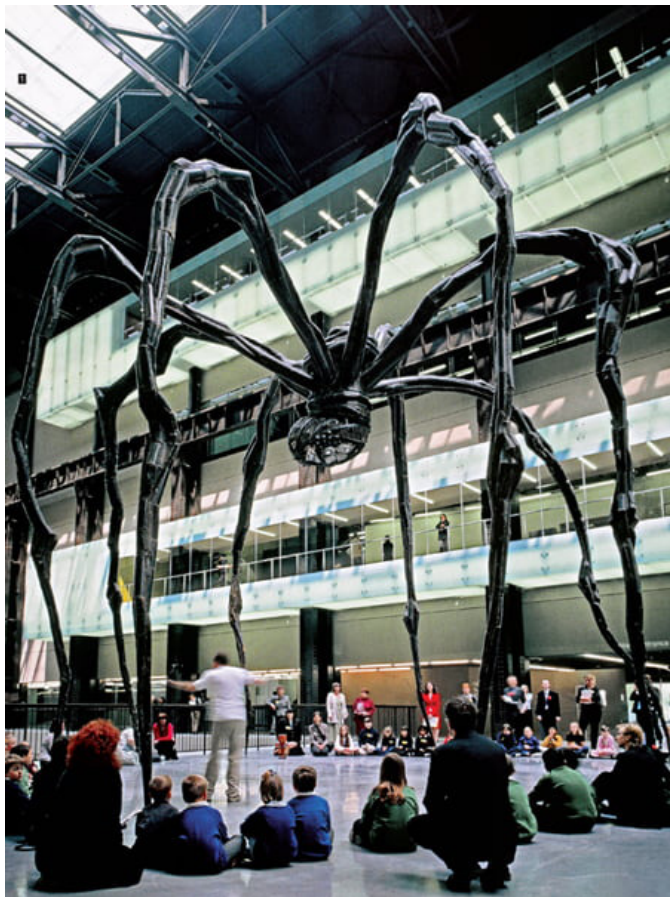
Maman , 1999, bronze, 1023,6 x 892,7 cm